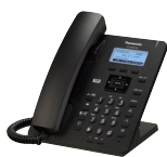
Panasonic Tischtelefon CHF 59.-

Spätestens Ende 2017 wird die ISDN und die analoge Telefonie nicht mehr unterstützt. Ein Wechsel auf die digitale Telefonie muss also vorgenommen werden. Auf Wunsch steht Ihnen für die digitale Telefonie eine grosse Auswahl an Endgeräten zur Verfügung. Falls nötig, können Sie das Paket um analoge Linien (z.B. für Fax) oder mit bis zu zwei Access Points erweitern. Gerne beraten wir Sie und prüfen, ob Sie Ihre bestehenden Endgeräte weiterverwenden können.