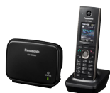
Panasonic Funktelefon CHF 79.-