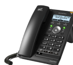
Alcatel Tischtelefon CHF 69.-